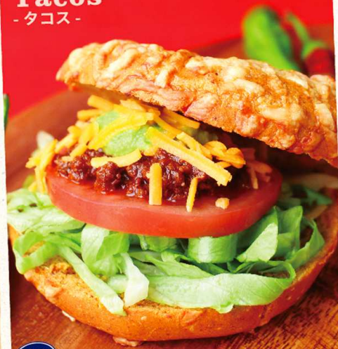
Tacos - タコス -